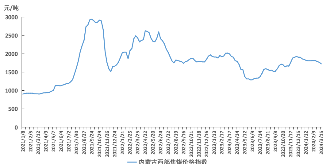
图 2 内蒙古西部焦煤价格指数运行图

截至 3 月 15 日，内蒙古西部焦煤价格指数报 1725 元/吨，周环比下跌 42 元/吨，跌幅 2.38%。