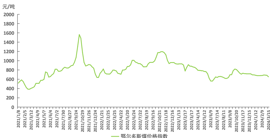
图 1 鄂尔多斯煤价格指数运行图

本期，鄂尔多斯煤价格指数周环比下跌。截至 3 月 15 日，指数报 653 元/吨，周环比下跌 30 元/吨，跌幅 4.39%。