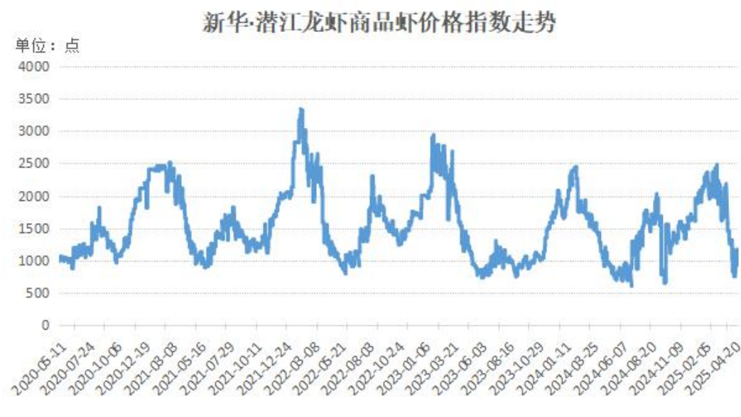
图1 新华·潜江龙虾商品虾价格指数走势（单位：点）