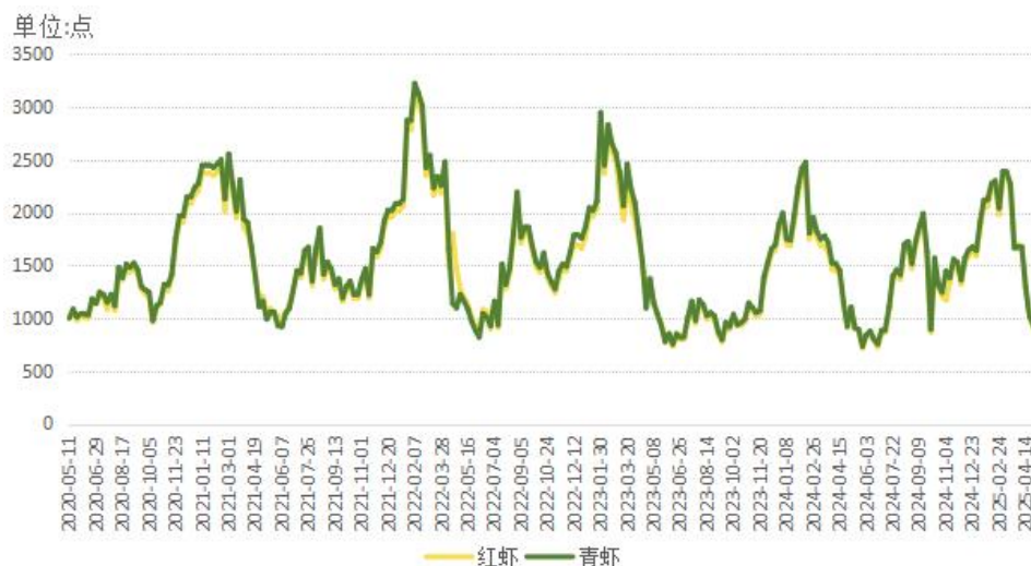
图2 红虾和青虾价格指数走势对比（单位：点）