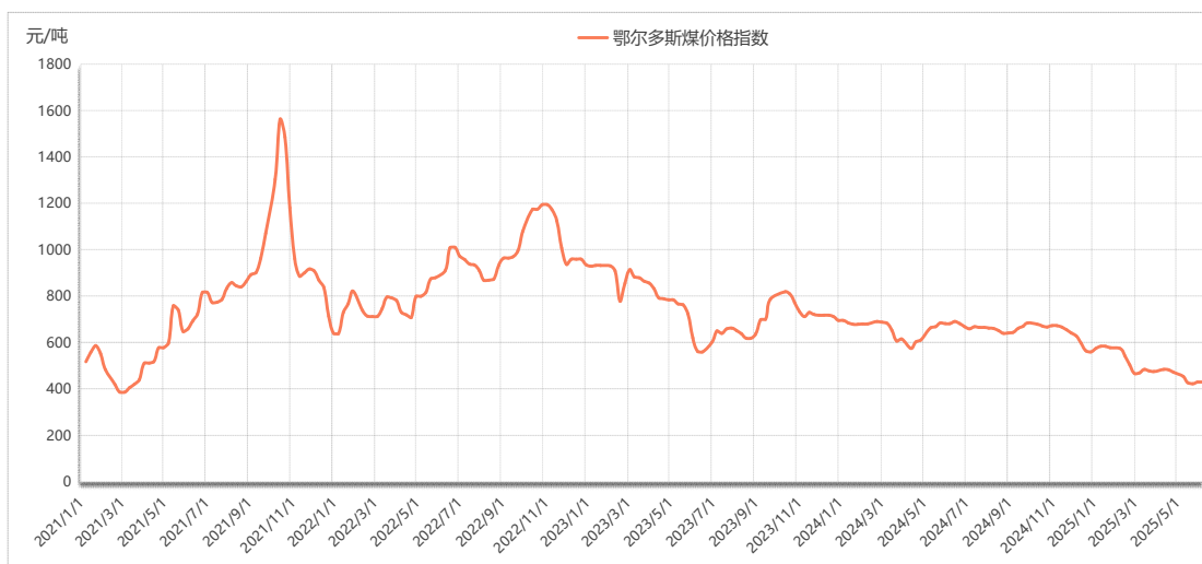
图 1 鄂尔多斯煤价格指数运行图

本期（6月2日-6月6日，下同），鄂尔多斯煤价格指数报 429 元/吨，与上期（5月26日-5月30日，下同）持平。