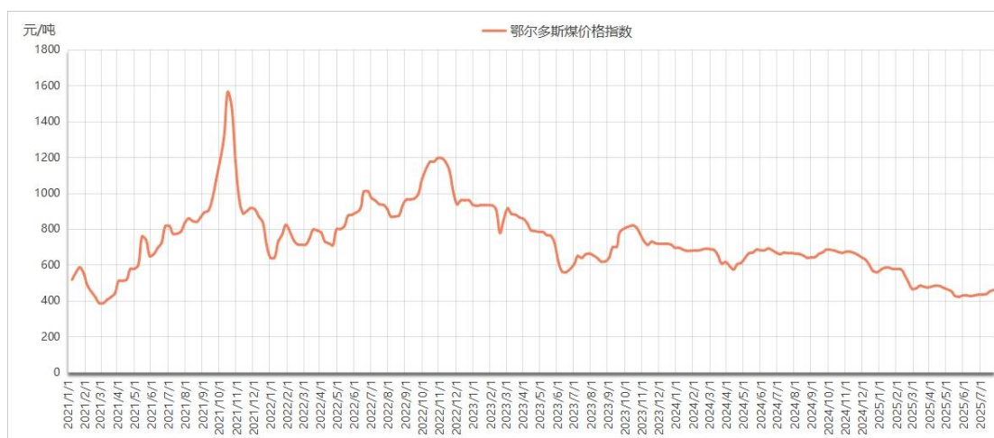
图 1 鄂尔多斯煤价格指数运行图

本期（7 月 21 日-7 月 25 日，下同），鄂尔多斯煤价格指数报 460 元/吨，较上期（7 月 14 日-7 月 18 日，下同）上涨 7 元/吨，涨幅 1.55%。