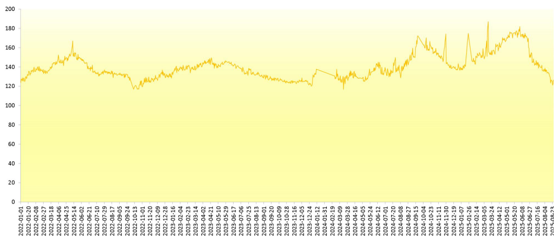
图 4 新华-香蕉销地批发价格指数