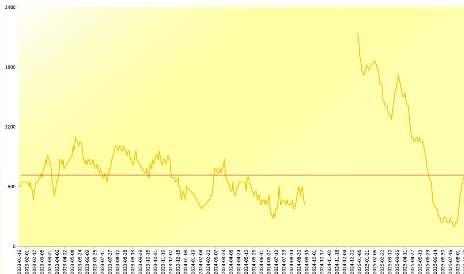
图 2 新华-中国（海南）皇帝蕉产地价格指数