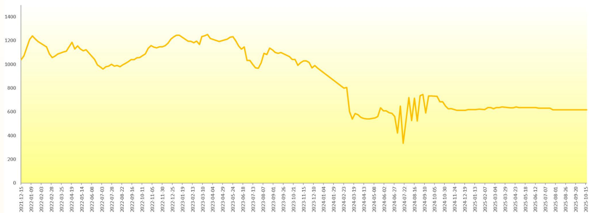
图 5 新华-进口香蕉价格指数