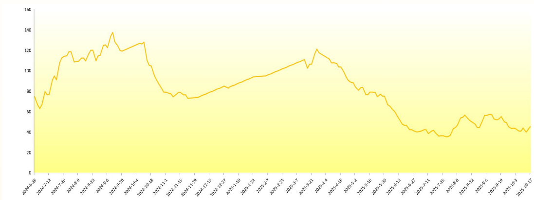
图 1 新华-中国香蕉产地价格指数