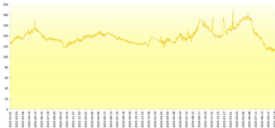
图 4 新华-香蕉销地批发价格指数