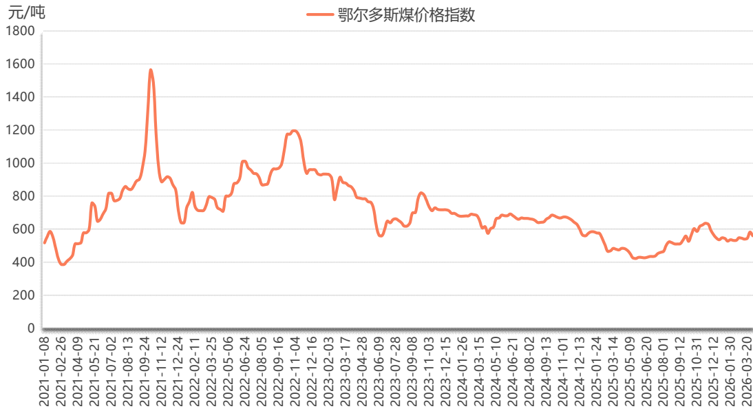
图 1 鄂尔多斯煤价格指数运行图

本期（3月28日—4月3日，下同），鄂尔多斯煤价格指数报559元/吨，较上期（3月21日—3月27日，下同）下跌23元/吨，跌幅3.95%。