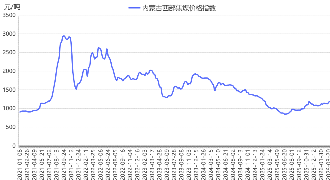
图 2 内蒙古西部焦煤价格指数运行图

本期，内蒙古西部焦煤价格指数报 1191 元/吨，较上期上涨 25 元/吨，涨幅 2.14%。