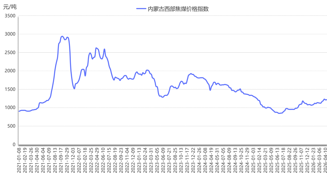
图 2 内蒙古西部焦煤价格指数运行图

本期，内蒙古西部焦煤价格指数报 1218 元/吨，较上期上涨 5 元/吨，涨幅 0.41%。