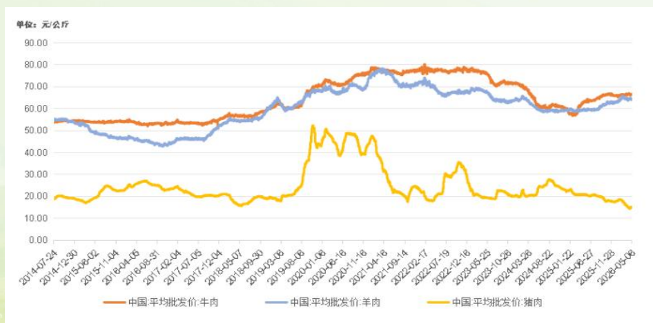
国内牛肉、羊肉、猪肉平均批发价格走势图

农业农村部监测数据显示，截至 2026 年 5 月 6 日，全国农产品批发市场牛肉平均价格报 66.76 元 / 公斤，羊肉报 64.34 元 / 公斤，猪肉报 15.19 元 / 公斤。