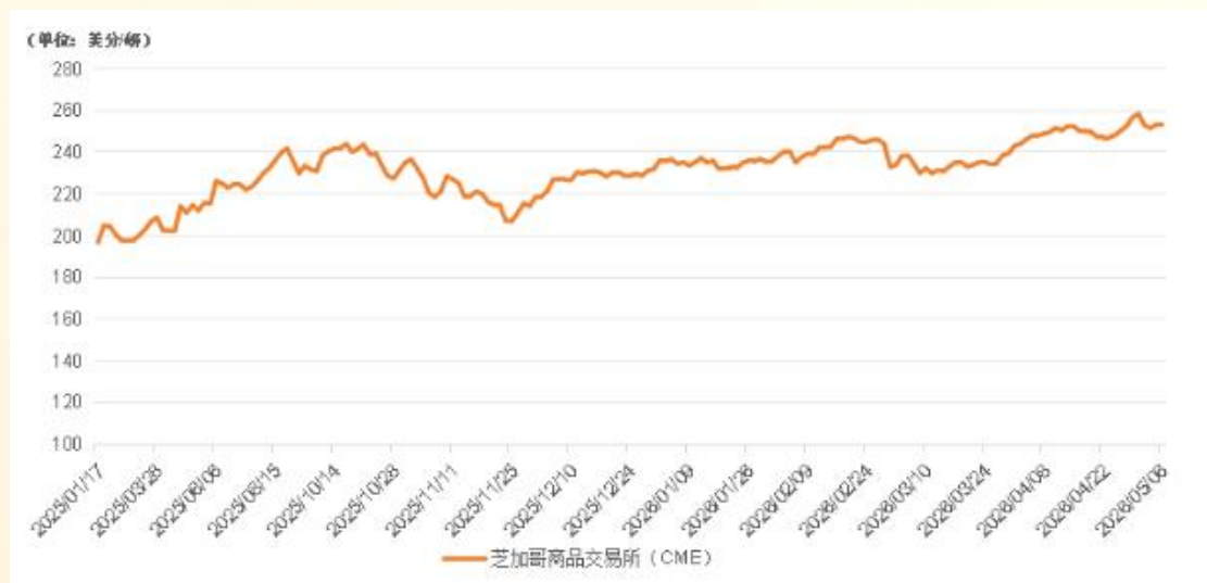
芝加哥商品交易所（CME）活牛期货价格走势

期货市场方面，截至 5 月 6 日，芝加哥商品交易所（CME）活牛期货价格报 253.475 美分 / 磅，较 4 月 22 日上涨 2.68%。