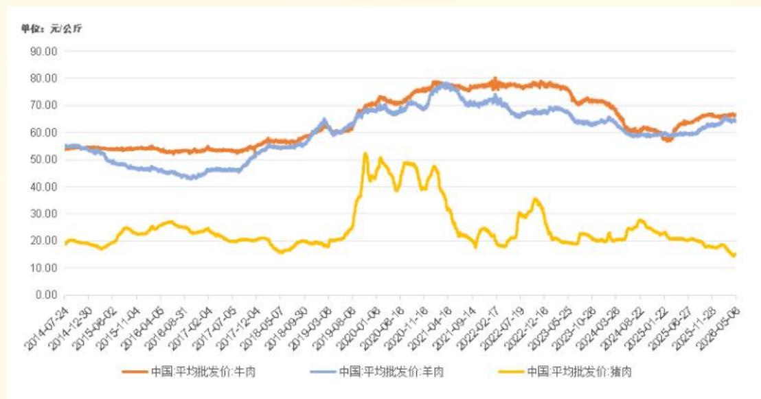
国内牛肉、羊肉、猪肉平均批发价格走势

农业农村部监测数据显示，截至 2026 年 5 月 6 日，全国农产品批发市场牛肉平均价格报 66.76 元 / 公斤，羊肉报 64.34 元 / 公斤，猪肉报 15.19 元 / 公斤。