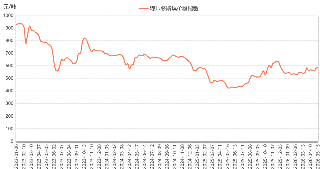
图 1 鄂尔多斯煤价格指数运行图

本期（5月9日—5月15日，下同），鄂尔多斯煤价格指数报585元/吨，较上期（5月2日—5月8日，下同）上涨5元/吨，涨幅0.86%。