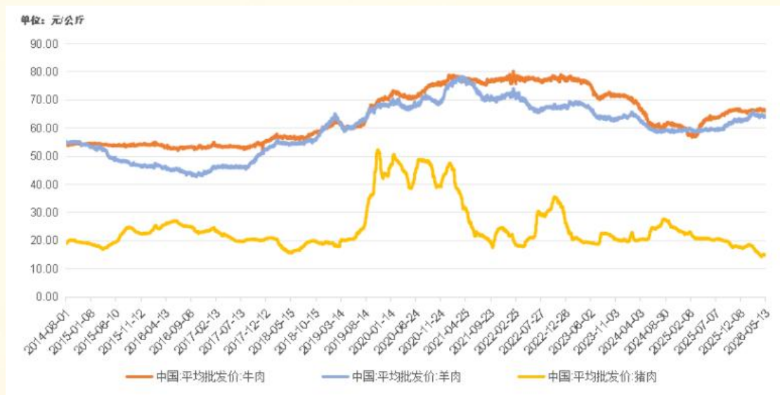
国内牛肉、羊肉、猪肉平均批发价格走势图

农业农村部监测数据显示，截至 2026 年 5 月 13 日，全国农产品批发市场牛肉平均价格报 66.57 元 / 公斤，羊肉报 64.48 元 / 公斤，猪肉报 14.93 元 / 公斤。