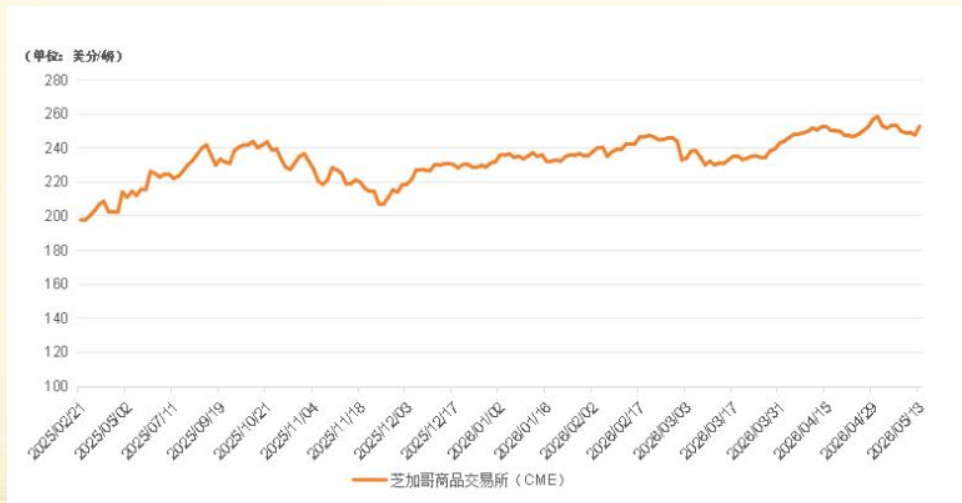
芝加哥商品交易所（CME）活牛期货价格走势