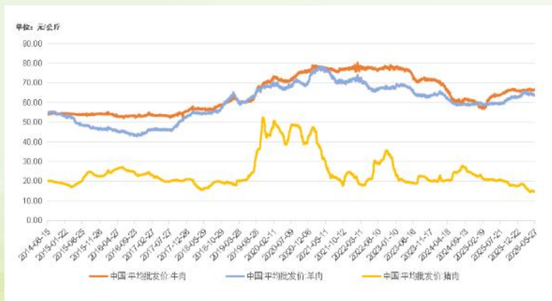
国内牛肉、羊肉、猪肉平均批发价格走势

农业农村部监测数据显示，截至 2026 年 5 月 27 日，全国农产品批发市场牛肉平均价格报 66.40 元 / 公斤，羊肉报 63.82 元 / 公斤，猪肉报 14.75 元 / 公斤