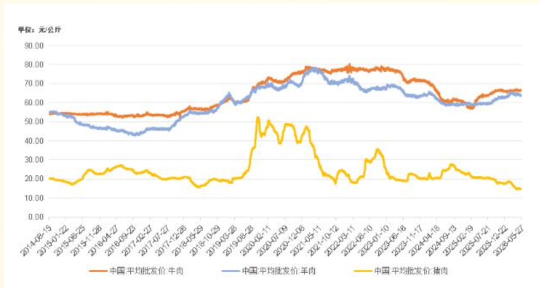
国内牛肉、羊肉、猪肉平均批发价格走势

农业农村部监测数据显示，截至 2026 年 5 月 27 日，全国农产品批发市场牛肉平均价格报 66.40 元 / 公斤，羊肉报 63.82 元 / 公斤，猪肉报 14.75 元 / 公斤。