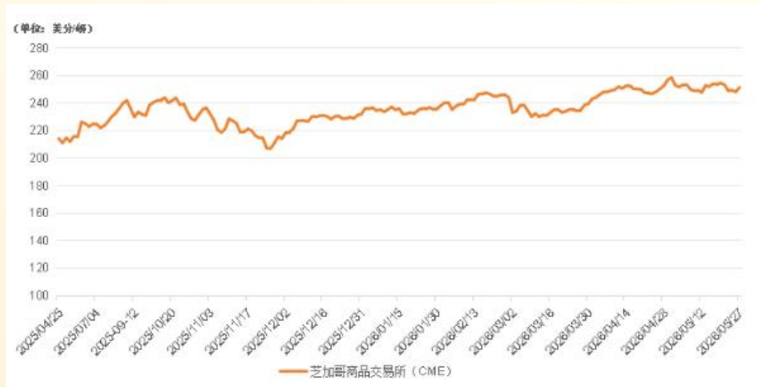
芝加哥商品交易所（CME）活牛期货价格走势