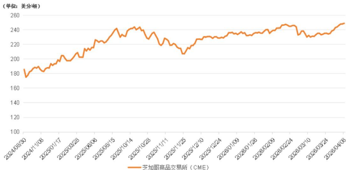
活牛期货价格走势

期货市场方面，截至4月8日，芝加哥商品交易所（CME）活牛期货价格报249.00美分/磅，较4月1日上涨2.03%。