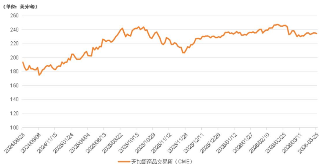
活牛期货价格走势

期货市场方面，截至3月25日，芝加哥商品交易所 (CME) 活牛期货价格报 234.425 美分 / 磅，较 3 月 18 日下跌 0.41%。