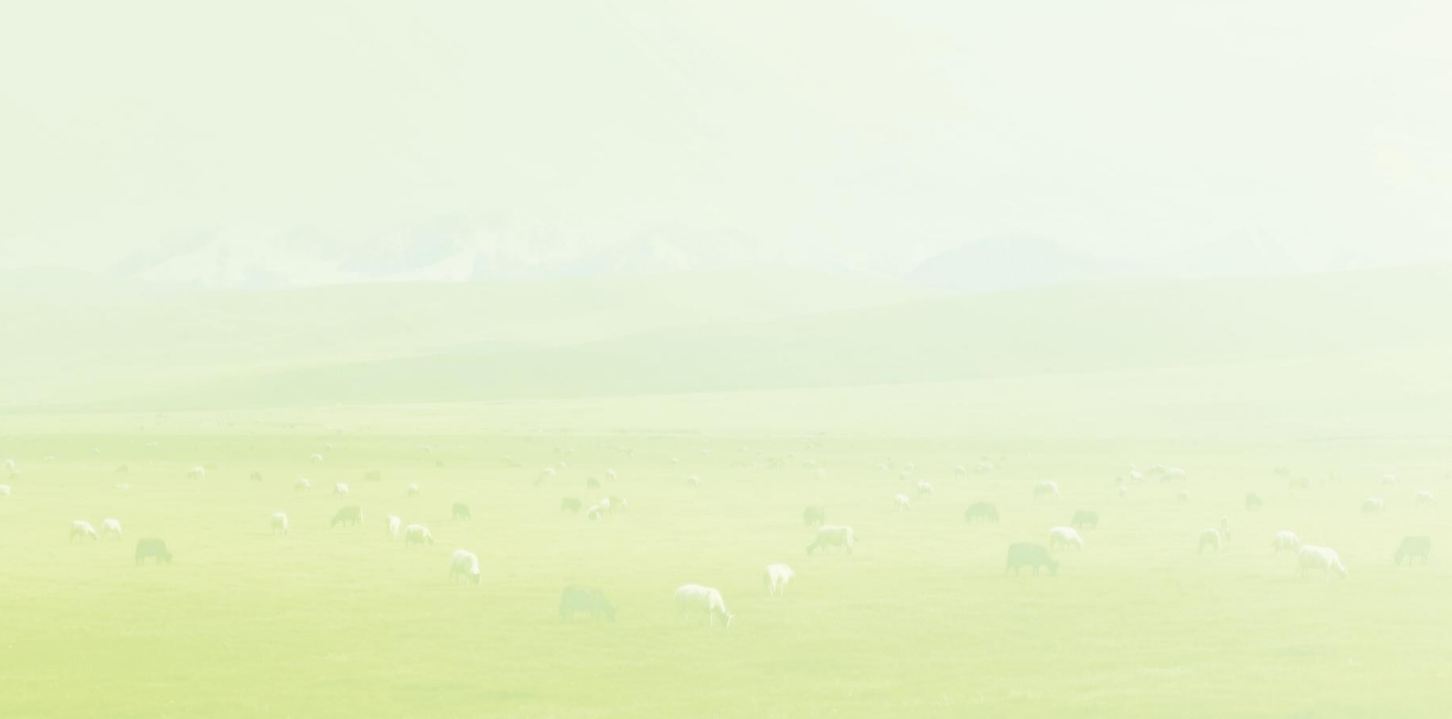
国内牛肉、羊肉、猪肉平均批发价格走势

农业农村部监测数据显示，截至 2026 年 6 月 10 日，全国农产品批发市场牛肉平均价格报 66.70 元 / 公斤，羊肉报 64.10 元 / 公斤，猪肉报 14.66 元 / 公斤。