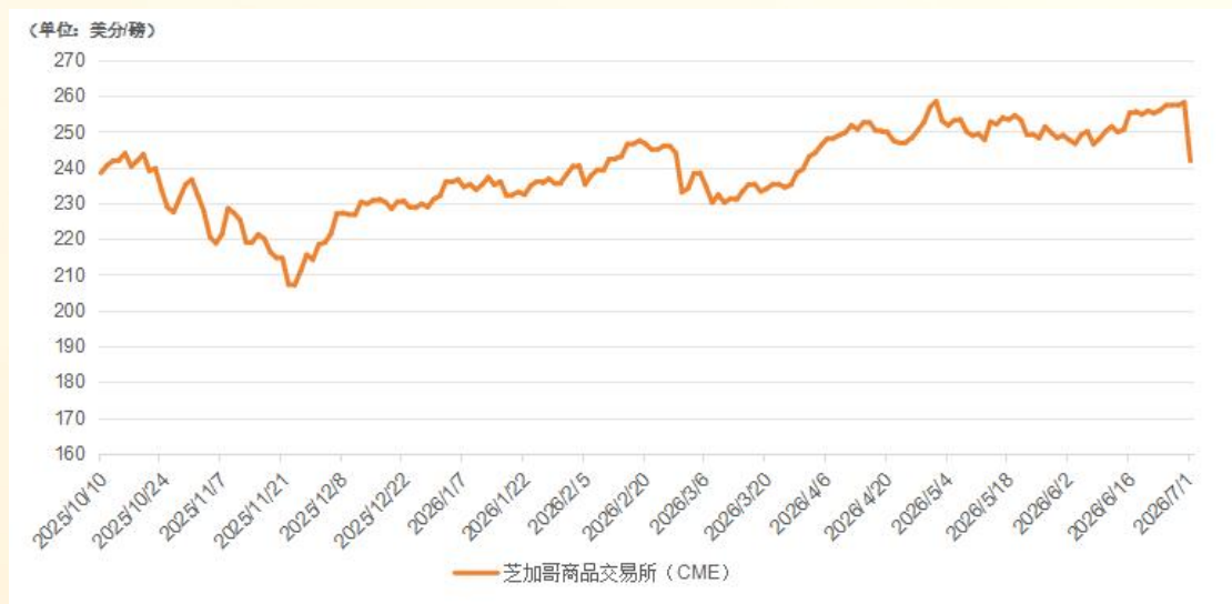
芝加哥商品交易所（CME）活牛期货价格走势